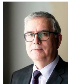
В.Н. Княгинин Вице-губернатор Санкт-Петербурга согласовывается