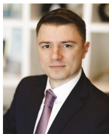
М.И. Иванов Заместитель министра МИНПРОМТОРГ согласовывается